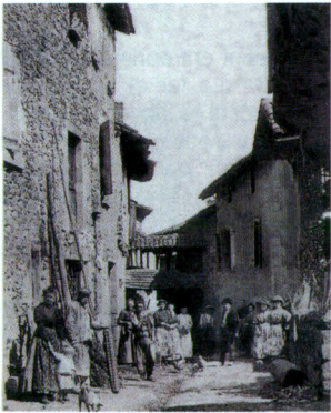
La rue du Coustalou

Aussi loin que l'on remonte dans le temps, il semble que Livinhac fut un centre important et le siège d'un grand commerce.