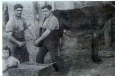
Le maréchal Ferrant

Des usines vont s'implanter, les mines de Decazeville vont être exploitées, le commerce va se développer et Livinhac va s'ouvrir vers l'extérieur.