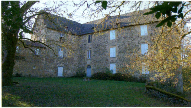
La cour du château

Ces lieux riches en histoire, furent le berceau d'une famille d'ancienne chevalerie.