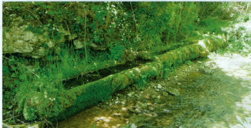
Abreuvoirs ruisseau de Vanc

Souyri et ses environs portent divers témoignages d'une occupation préhistorique, celtique et gallo-romaine – notamment la villa dont les fondations sont visibles d'avion par temps sec. Au Moyen-âge, c'était une halte de pèlerins, au carrefour de deux chemins : le chemin de l'Evêque, qui descendait dans le vallon en passant par Vanc et Saunhac, et la grande draille du Quercy vers l'Aubrac.