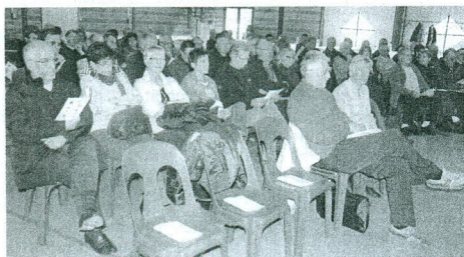
37 associations étaient représentées à l'assemblée générale qui s'est tenue samedi 13 mars, à Vabres-L'Abbaye