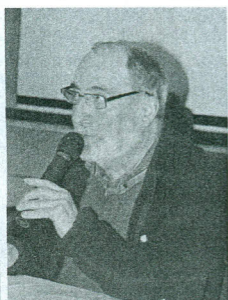
Le président du Comité départemental de la randonnée pédestre a présenté un bilan positif

Le Comité départemental de la randonnée pédestre de l'Aveyron a tenu son assemblée générale ordinaire, samedi 13 mars, à Vabres-L'Abbaye. La séance a donné lieu à lecture des différents rapports (moral, activités, sentiers, formation) qui laissent apparaître un bilan très positif des nombreuses activités du Comité grâce à l'engagement des bénévoles toujours disponibles et généreux dans l'effort.